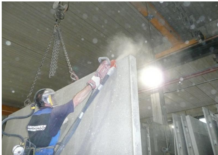
Kuva 10. Seinäelementin viimeistely käsihiomakoneella, johon on kytketty pölynpoistomuri.

Betonielementteihin saattaa jäädä valupurseita, esimerkiksi muottien saumakohtiin ja varauksiin. Lisäksi varauksia saatetaan tehdä jo kovettuneeseen betoniin. Valupurseita poistetaan ja varauksia tehdään tapauksesta riippuen mm. kulmahioma- ja piikkauskoneilla, jotka aiheuttavat pölypäästöjä. Joissakin tapauksissa betoniseiniin on vaadittu tehtäväksi betonipinnan ns. sementtitiiman poisto hiekkapuhaltamalla tai laikkaamalla, mitä on perusteltu betonipinnan liian alhaisella tartuntalujuudella. Betoniteollisuuden näkemys tehtyjen testien perusteella on, että erilaiset betonipinnat antavat riittävän tartunnan pinnoille, kun pintakäsittely tehdään oikein, eikä pinnan hiontaan tai muihin jälkikäsittelyihin tuolloin ole tarvetta. Tällöin kustannuksia säästyy ja työntekijöiden pölyttömän työympäristön kehittäminen saa paremmat mahdollisuudet.