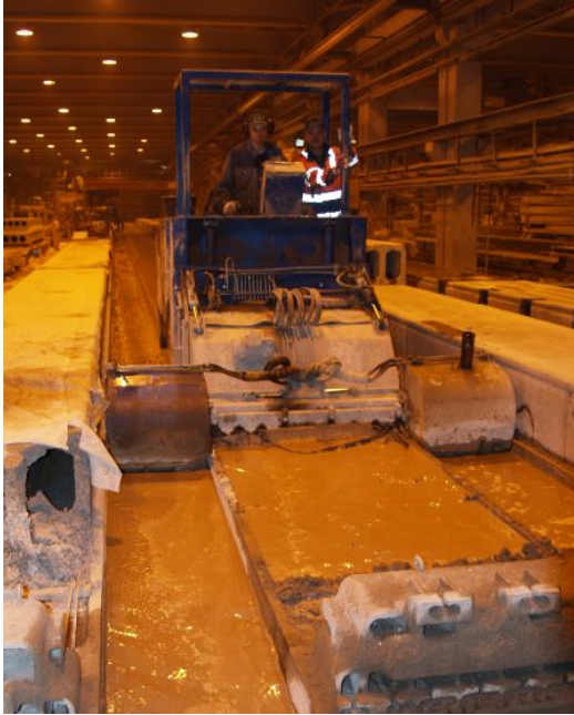
Kuva 4. Valualustojen ja niiden välien puhdistus.

Muottien puhdistus on eräs pölyävimmistä työvaiheista betonielementtien valmistuksessa. Elementtien irrotuksen jälkeen valumuotit puhdistetaan yleensä joko harjalla tai lastalla, mutta myös paineilmaa voidaan käyttää. Lastauksessa muosteista irrotetaan kiinnijäänyt betonimateriaali ja muu mahdollinen tarttunut lika. Kuivaharjauksella käytetään yleisesti pintojen puhdistukseen ennen muottirakenteiden kokoamista. Kvartsipölyhankkeen aikana tehdyissä mittauksissa pölypitoisuus ylitti kuivaharjauksessa hetkellisesti jopa moninkertaisesti HTP-arvon, riippuen harjauksen voimakkuudesta ja alustan liikaisuudesta. Muottialustasta vapautunut pöly jää leijumaan hengitysvyöhykkeelle ja nostaa merkittävästi elementtityöntekijöiden työpäivän kokonaisaltistumistasoa.