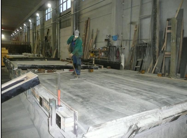
Kuva 2. Muotin puhdistamisessa tulee käyttää märkäsiivousmenetelmiä tai keskuspölynimuria. Mikäli tämä ei ole mahdollista, tulee siivottaessa käyttää pölynsuojaimia.

Imurilaitteet on tarkastettava silmämääräisesti vähintään kerran viikossa ja jos tietyt laitteet ovat jatkuvassa käytössä, ne tulee tarkastaa useammin. Jos joitakin laitteita käytetään epäsäännöllisesti, ne täytyy tarkastaa ennen jokaista käyttökertaa. Puhdistuslaitteet tulee tarkastaa vähintään kerran vuodessa ja tarkastuksista on pidettävä kirjaa lain-säädännön määrittelemältä ajanjaksolta, joka on minimissään viisi vuotta.