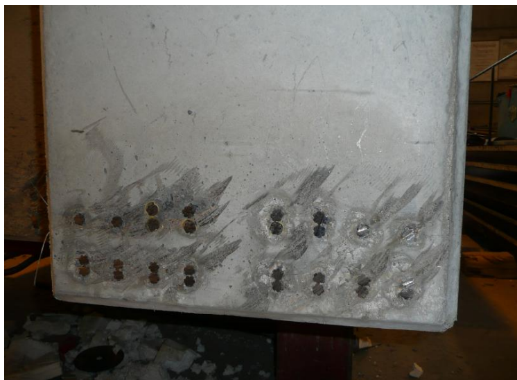
Kuva 6. Katkaistaessa jännepunoksia kulmahiomakoneella osutaan aina samalla myös kovettuneeseen betoniin, mikä aiheuttaa pölypäästöjä.

Jännepunosten katkaisu tehdään usein samoissa tuotantotiloissa kuin muut tehtaan työvaiheet ja prosessit. Tämän vuoksi myös toiset kyseisissä tuotantotiloissa työskentelevät työntekijät altistuvat punoskatkaisun yhteydessä vapautuville epäpuhtauksille. Altistumisen voimakkuuteen vaikuttavat työtiloissa vallitsevat ilmavirtaukset, painesuhteet sekä lämpöolosuhteet, jotka edesauttavat epäpuhtauksien leviämistä. Puutteelliset torjuntatekniset ratkaisut lisäävät altistumista.