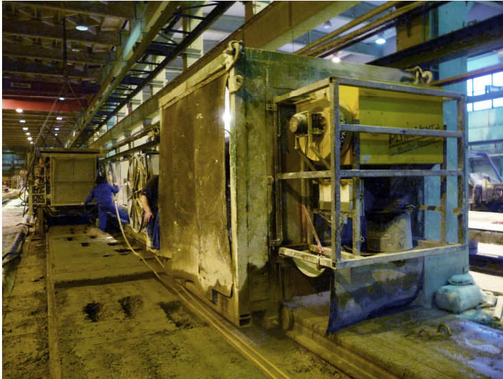
Kuva 8. Ontelolaatan sahaus. Saha on koteloitu ja varustettu kohdepoistolla.

Ontelo- ja kuorilaattojen katkaisu tehdään valualustasahauksena laatan päältä. Sahaus voidaan tehdä laatan pituus- tai poikittaissuuntaisesti tai vinoon. Pituus- ja poikittaissuuntaista sahausta käytetään yleisesti.