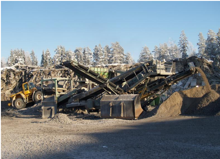
Kuva 11. Ylijäämäbetonin murskausta.

Kun betonia murskataan, pölyn leviämistä on hyvin vaikea estää. Ajoittamalla murskaus sateiseen vuodenaikaan tai kastelemalla betonia voidaan pölyn määrää vähentää. Murskainlaitteen käyttäjän täytyy olla eristettynä pölystä ja laitteen ohjausyksikön tulee sijaita riittävän kaukana pölyn lähteestä. Tällöin voidaan käyttää apuna TV-kamerajärjestelmää. Jos murskausta valvotaan tai ohjataan murskaimen välittömässä läheisyydessä, tätä varten on järjestettävä tiivis, suljettu hytti. Lisäksi hyttiin tulee olla ylipaineistettu puhtaalla ilmalla tai vaihtoehtoisesti hytissä pitää olla tuloilman hienopölyn suodattava ilmansuodatin.