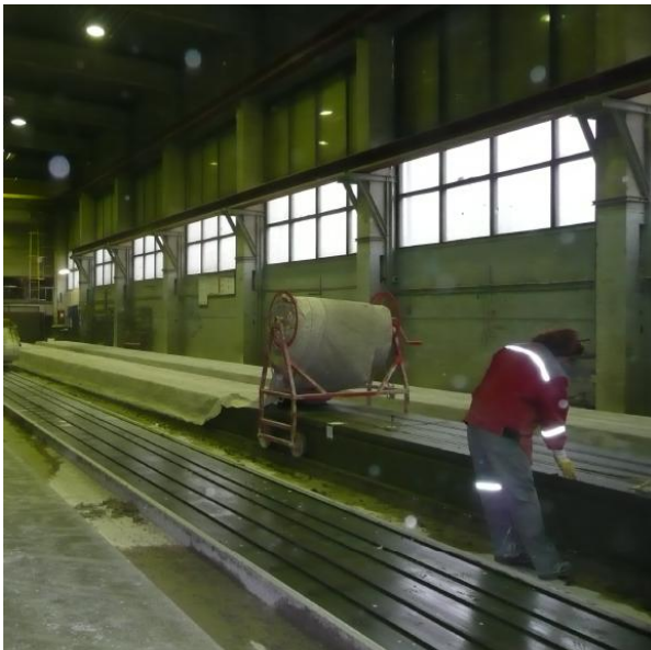
Kuva 7. Ontelolaatan suojapeitteen levityksessä käytetään apuna rullatelinettä.

Suojapeitteisiin jää usein hienojakoista pölyä, joka voi betonin kuivuttua vapautua hengitysilmään peitteiden levitys-, käsittely- ja siirtovaiheissa. Kyseisissä tilanteissa on kiinnitettävä huomiota pölyn hallintaan. Yleisesti käytössä olevat työtavat ovat syntyneet yrityskohtaisten innovaatioiden kautta.