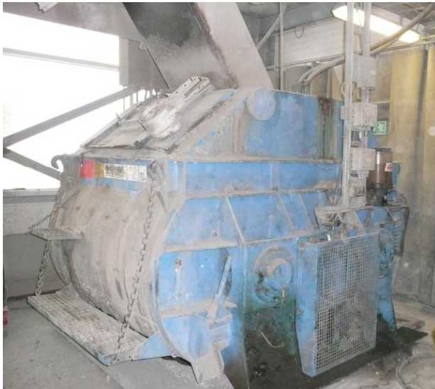
Kuva 3. Betoninsekoitin.

Betonin valmistuksessa käytettävä kiviaines annostellaan betoninsekoittimeen yleensä hihnavaa'an avulla. Hihnavaa'an pölypäästöjä voidaan vähentää sulkemalla vaaka-aluetta esimerkiksi pressulla ja järjestämällä vaa'alle pölynpoisto.