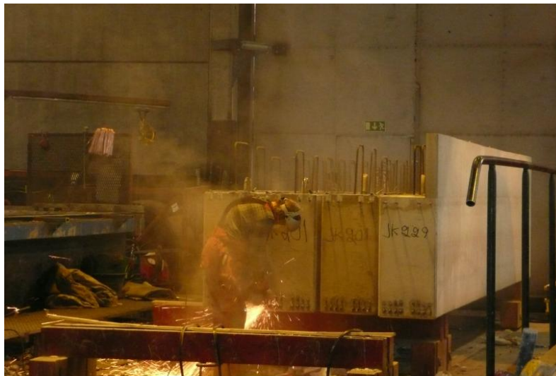
Kuva 5. Jännepunoksen viimeistelykatkaisu kulmahiomakoneella. Työntekijän tulee käyttää moottoroitua tai paineilma-verkkoon liitettyä hengityksensuojainta.

Työhygieenisten mittausten mukaan työntekijät altistuvat työpäivän aikana HTP-arvot ylittävälle pöly- ja kvartsipitoisuuksille jännepunosten katkaisussa. Työvaiheen kestosta ja viimeisteltävien elementtien määrästä riippuen työpäivän keskimääräiset altistumistasot saattavat nousta hyvinkin suuriksi.