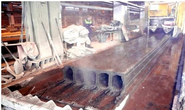
Kuva 9. Ontelolaatan pituussuuntainen sahaus aiheuttaa runsaasti pölypäästöjä, jotka saattavat levitä kauas sahauskohdasta laatan onteloita pitkin.