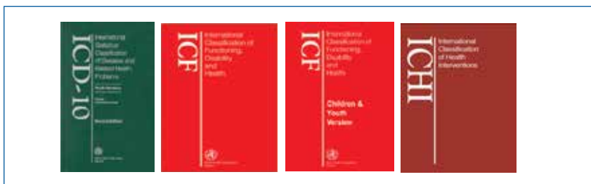
Kuva 1. Maailman terveysjärjestön WHO:n kansainvälinen luokitusperhe: tautiluokitus (ICD), toimintakyvyn ja terveyden osatekijöiden luokitus (ICF ja ICF-CY) sekä tulossa oleva interventioiden luokitus (ICHI).

ICF-arviointilomaketta, jota kutsutaan myös nimellä Rehabilitation Problem Solving (RPS) -lomake (kuvi 2), voidaan käyttää apuna kerätessä tietoa kuntoutujan toimintakykyään koskevista näkemyksistä. Se ohjaa moni-