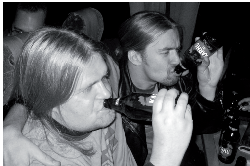
Kuva 1. Kaksi miestä juo kaljaa