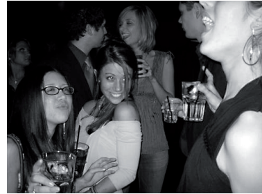
Kuva 5. Nuoret naiset pitävät hauskaa

Ote 10 konkretisoi puolestaan tarinalinjaa, joka edellä kilpaili naisten keskinäisen hauskanpidon kanssa sille alisteisena sivujuonteena, kehkeyty- en tässä itsenäiseksi tarinalinjaksi, jossa tilannet- ta määritellään kategoriolla ”kaikki humalassa”, ”vedetään rivissä shotteja baaritiskillä”, ”tanssi-