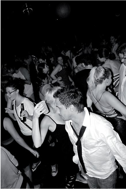
Kuva 4. Nuoret tanssivat ja juhlivat ravintolassa

sen näköstä et lähetään ja pidetään hauskaa, siinä voi olla just et suurin osa seurustelee ja et jotkut on tommosii flirttejä mut mun mielestä enemmänki et keskenään pidetään hauskaa.