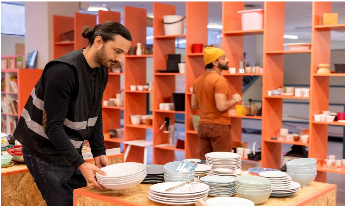
Kuva 3. Työn suunnittelu auttoi erittäin paljon sitä, että työ sujui