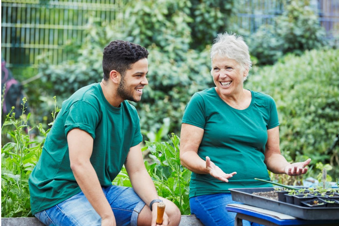
Kuva 2. Tutkijat havainnoivat työtä eri paikoissa, myös ulkona.

Aina esihenkilöt eivät voineet tukea työntekijöitä, koska heillä ei ollut aikaa. Myös esihenkilöt tarvitsivat uusia taitoja, että he osasivat tukea työntekijöitä. Myös valmentajan apua kaivattiin työpaikoille lisää.