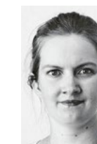
Henna Iire Matemaatikko ETK