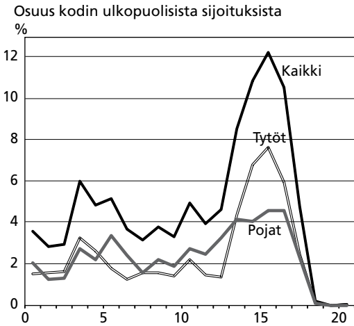
Kuvio 2. Osuus kaikista kodin ulkopuolisista sijoituksista (n=1 900) ensimmäisen sijoitusiän mukaan sukupuolet yhdessä ja erikseen

kolmannesta (66,3 %) kodin ulkopuolelle sijoitetuista oli seuranta-aikana sijoitettuna yhteensä kauemmin kuin vuoden, reilu kolmasosa kaikista sijoitetuista kuitenkin yli 5 vuotta (35,2 %). Laitoshoidossa oli ollut jossain vaiheessa elämänsä yli puolet sijoitetuista, vajaa 40 prosenttia perhehoidossa ja vajaa kolmannes ammatillisessa perhehoidossa (taulukko 2).